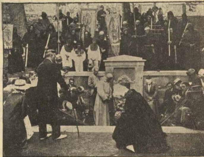
Ved San Antonia-Kilden.

Den herreløse Hest vækker Skræk og Fortvivlelse