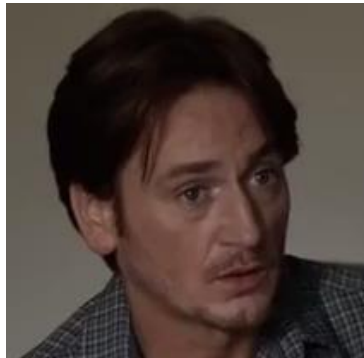
B - L'éducateur