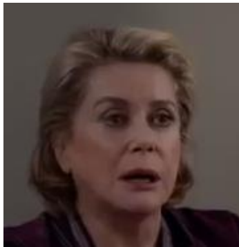
A - La juge pour enfants

2. Associe le bon métier aux personnages du film.